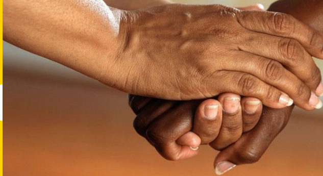
WoHealth – Maahanmuuttajanaisten voimaantumisen tukeminen